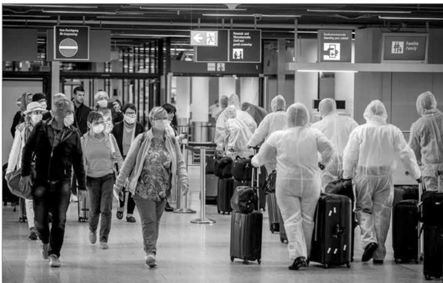
Slika 1: Pandemija je sprožila nova eksistenčna in eksistencialna vprašanja ter nas prisilila k ponovnemu razmisleku o oblikovanju naših naselij in mest.

smo v tržno gospodarstvo stopili s precejšnjimi primerjalnimi prednostmi pred drugimi socialističnimi državami. Slovenija je do leta 1993 preživela težko obdobje vzpostavljanja države. Oživljanje slovenskega gospodarstva, ki se je začelo leta 1993, je izhajalo predvsem iz hitre rasti domačih dohodkov, domače porabe in izvoznega povpraševanja, ki je omogočilo izkoriščanje skrajno neizkoriščenih proizvodnih zmogljivosti in delovne sile. Med glavne vzroke, ki so prispevali k relativno visokim stopnjam gospodarske rasti, štejemo dobro izpeljane strukturne reforme in s tem povezano učinkovito alokacijo resursov, mir v državi, geografsko bližino držav Zahodne Evrope, odpiranje tržišča in usmeritev na svetovne trge, učinkovit šolski sistem in relativno dobro implementiranje institucionalnih sprememb. Slovenija je tako res precej uspešno prebrodila obdobje začetne tranzicije, saj je dosegala relativno visoke in predvsem stabilne stopnje gospodarske rasti.