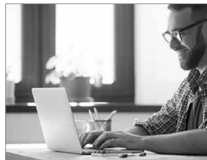
Slika 5: Pričujoča kriza kaže, da je mogoče z novimi telekomunikacijskimi tehnologijami učinkovito delovati tudi v omejenih pogojih gibanja prebivalstva.

Urbana razpršenost je problem, vendar tudi priložnost. Pričujoča kriza kaže, da je mogoče z novimi telekomunikacijskimi tehnologijami učinkovito delovati tudi v omejenih pogojih gibanja prebivalstva. Morda bo dozorelo spoznanje, da bo mogoče z delom na domu razbremeniti že preobremenjen prometni sistem ter hkrati zmanjšati stroške in omogočiti ljudem več prostega časa za kulturo, šport in izobrazbo. Pri