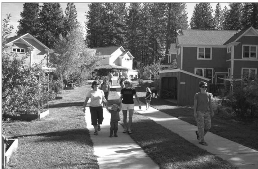
Slika 7: Urbanistični koncepti iz 60. in 70. temeljijo na ideji soseske in manjših sosedskih skupnosti, v katerih je bila skrb za človeka pomembnejša kot dobiček kapitala.

številnih opravilih že danes ni več potrebe po fizičnem združevanju ljudi ob delu, zato ostaja želja po druženju le še kulturna potreba, del katere je tudi kultura prostora in arhitekture. In potrošnja kulture je lahko brezmejna. Je energetske vzdržna in brez velikih stranskih učinkov na okolje. Tudi zaradi prisotnosti in podpore stroke. Današnji množični beg meščanov v počitniške domove na podeželju in povečano povpraševanje po nepremičninah v širšem obrobju mest, od koder uspešno poslujejo na daljavo, je morda napoved nove oblike dejavnostne in poselitvene slike Slovenije in delovanja družbe kot celote. Pandemija bo vsekakor vplivala na spremembo temeljnih vrednot v današnjih neoliberalnih družbah. Ponovno se bo vzpostavila potreba po bolj socialni državi, ki mora zadovoljiti in poskrbeti za potrebe prebivalcev tudi na primarni ravni. Med njimi je potreba po splošni kulturi, del katere sta tudi kultura prostora in arhitektura. In potrošnja kulture je lahko brezmejna. Je energetske vzdržna in brez velikih stranskih učinkov na okolje. Tudi zaradi prisotnosti in podpore stroke.