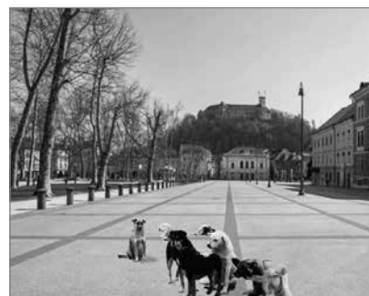
Slika 6: Kako bomo oblikovali mesta in naselja prihodnosti, da prostori teh ne bodo postali območja prepovedi, ampak varen javni prostor?