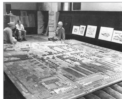
Slika 3: Frank Lloyd Wright: »Mesto je proces, ne pa oblika. Mesto bi moralo biti povsod in nikjer.«

Novonastalo slovensko »somestje« ima značaj fleksibilno organizirane strukture, ki se je sposobna prilagajati dinamiki nove stvarnosti ter absorbirati tudi obstoječe urbane strukture in izoblikovati nove vitalne celote. Na slovenski prometni križ, ki ga tvorijo avtocestne in železniške povezave, so navezani urbana središča, gospodarske cone in turistična območja, prek sekundarnih prometnih sistemov pa tudi periferne regije. V konceptu takega »vrtnega mesta« je bivanje na podeželju enakovredna lokacija za nastanek nove urbane kulture, kjer zaradi razvoja informatike fizična lokacija ni več tako pomembna ter se lahko oblikuje primerljiva izobrazbena, gospodarska in splošna družbena kultura na različnih točkah v različno strukturiranem fizičnem okolju. Ta koncept vodi v brisanje razlike med mestom in podeželjem, govorimo o pojavu nove urbane ali krajinske kompleksnosti, kjer se tudi v mestih postavlja načelo fleksibilnosti in mobilnosti pred merilom hierarhije in reda. Nastajajoča urbanokrajinska struktura ob oseh prometnega križa je torej dinamičen mozaik naravnih in ustvarjenih elementov in je vsakokrat obarvana izrazito ekološko. Na koncih krakov opisane urbane strukture, na njenem stiku z nacionalnimi mejami, se razvijajo območja mednacionalne kulturne in gospodarske pobude, ki so pomembne koncentracijske točke za ohranjanje