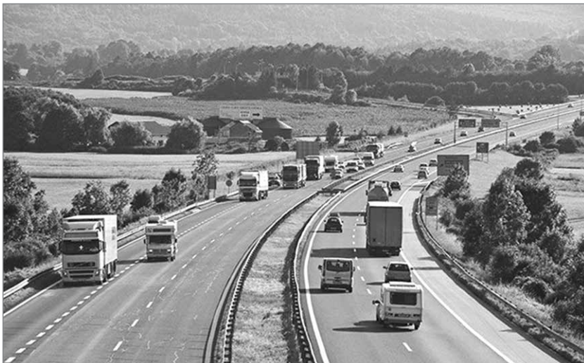
Slika 4: Dobro prometno omrežje v obliki prometnega križa zagotavlja učinkovito delovanje slovenske urbane strukture kot funkcionalno in pojmovno enotnega prostora.

lokalne samobitnosti in identitete. Poleg tretje (in morda tudi četrte) razvojne osi bo v prihodnje v obmejnih območjih praznjenja s stimulativnimi pogoji in atraktivnimi dejavnostmi zagotoviti vsaj minimalno poseljenost in tako skleniti urbani obroč okoli nacionalnega prostora. V ta namen bo treba vzpostaviti tudi hitre radialne povezave, ki bodo omogočale povezave med posameznimi obmejnimi regijami in tudi povezave obmejnih območij praznjenja z AC-koridorji.