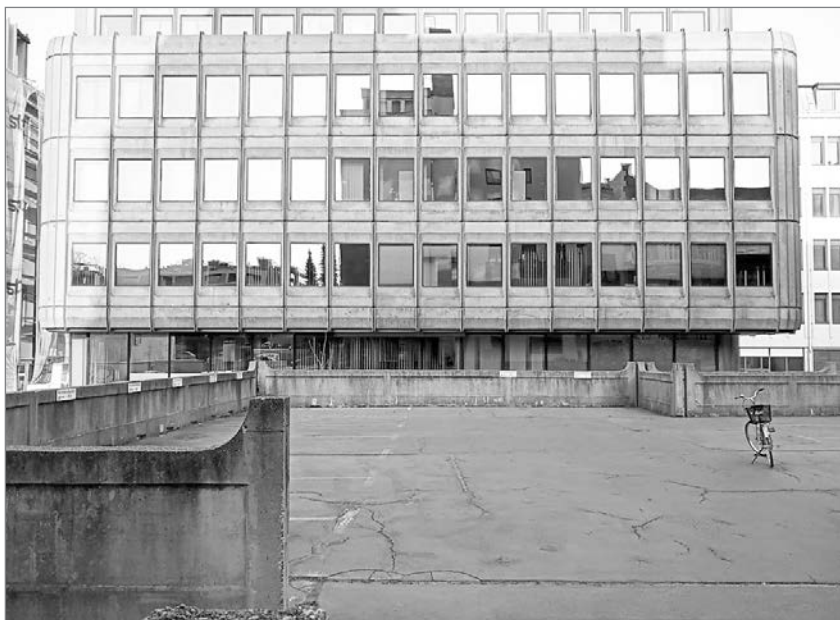
Slika 3: Cankarjeva 3 v Mariboru – pogled z zadnje ploščadi

Cankarjevo ulico v Mariboru že od konca sedemdesetih let prejšnjega stoletja zaznamuje markantna stavba, v kateri od samega začetka kontinuirano poslujejo zavarovalniške družbe. Objekt je plod sodelovanja arhitektke Slave Rojak in arhitekta oblikovalca Branka Kraševaca. Zadnji je h končni podobi arhitekture prispeval inovativno fasadno rešitev iz litega aluminija, ki daje zunanosti zgradbe edinstven pečat. Fasada velja za oblikovalčevo najprepoznavnejše delo v Mariboru in ji je bil z vpisom v Register nepremične kulturne dediščine že priznan ustrezen status. Zaradi specifične tipologije in svojevrstnega oblikovanja izrazito odraža duha časa, v katerem je bila postavljena. Danes pisarniški objekti še vedno krojijo