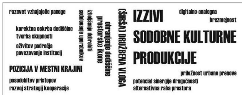
Slika 1: Miselna shema – metodološki kolaž (ilustracija: Darja Horvat)

Kljub naraslemu zanimanju in povpraševanju, kulturnemu udejstvovanju ostaja imanentna obrobna narava. Umeščanje takih vsebin v obstoječa tkiva zahteva iskanje lokacij s potencialom drugačnosti. Prepoznavanje take lokacije je naloga,