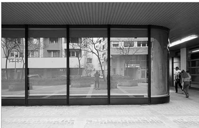
Slika 4: Zrcalo kot presečna točka

urbane krajine svetovnih metropol, vendar pa se trend njihove pospešene gradnje obrača zaradi spremenjenih oblik poslovanja in delovnih navad ter posledičnih presežkov tovrstnih tipologij na nepremičninskih trgih. Številni strokovnjaki si tako drzno napovedati še večje število praznih poslovnih zgradb po vsej Evropi. V tekočem letu naj bi se izpraznila tudi omenjena stolpnica na Cankarjevi ulici v Mariboru. Prilagoditve poslovnih objektov v stanovanjske se zaradi primanjkljaja stanovanj zdijo smiseln korak, ki se že uveljavlja v praksi.