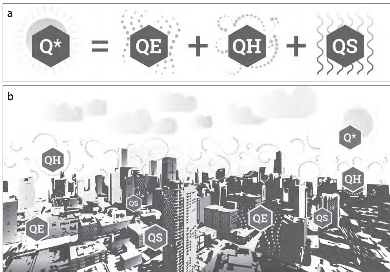
Slika 2: Formula (a) in grafični prikaz energijske bilance površja (b) (avtor: Frank van der Hoeven)

Opombe: Q^* : neto sevanje, QE : latentni toplotni tok, QH : senzibilni toplotni tok, QS : shranjeni toplotni tok.