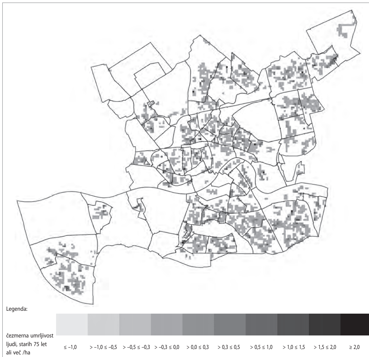
Slika 5: Čezmerna umrljivost prebivalcev, starih 75 let ali več, julija 2006, izražena v absolutnih številkah (avtor: Frank van der Hoeven)

je julija 2006 umrlo 1.000 nizozemskih državljanov več kot običajno. S 1.000 umrlimi zaradi rekordne vročine je bila leta 2006 Nizozemska na tretjem mestu svetovne lestvice meteoroloških nesreč (CRED, 2016). Zaradi teh dejstev sta se avtorja odločila, da bosta julij 2006 vzela kot model, na podlagi katerega bi lahko napovedala, kakšna bodo prihodnja poletja v Rotterdamu. Mestna občina Rotterdam je julija 2006 evidentirala 75 smrtnih primerov več, kot je povprečje za ta mesec (izračunano za obdobje 2000 – 2013). V primerjavi s povprečjem, ugotovljenim za celotno obdobje 2007 – 2013, pa je ta številka še večja (tj. 90 smrtnih primerov več).