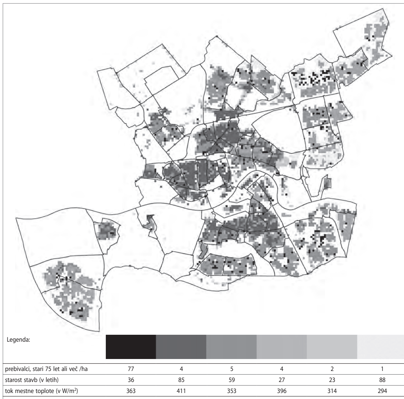
Slika 7: Družbena temperaturna karta: prostorski vzorec ogroženosti starejših zaradi vpliva mestnega toplotnega otoka v Rotterdamu