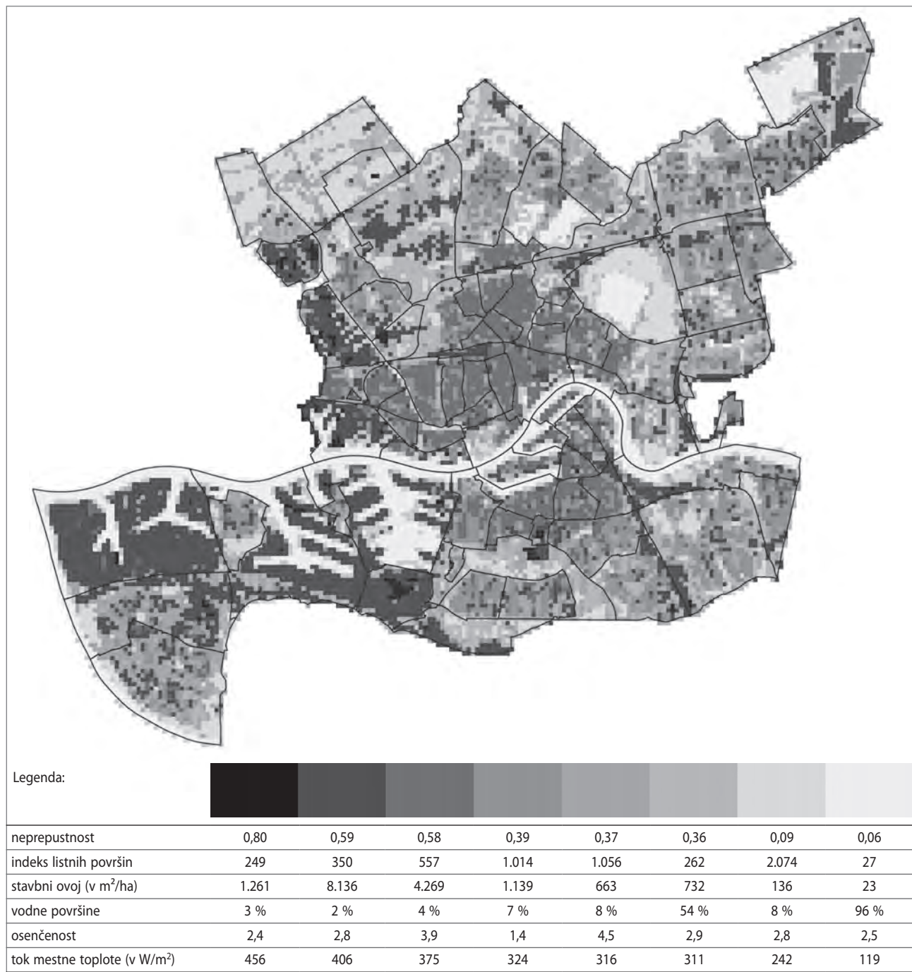
Slika 8: Prostorska temperaturna karta: prostorski vzorec rabe tal in urbane oblike, ki bolj ali manj prispevajo k nastanku mestnega toplotnega otoka v Rotterdamu

Opombe: ** p < 0,005 , B: nestandardizirani regresijski koeficient, SN_B : standardna napaka koeficienta, \beta : standardizirani koeficient, odvisna spremenljivka: tok mestne toplote.