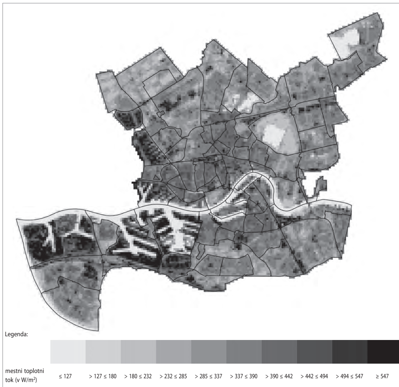
Slika 4: Skupni senzibilni in shranjeni toplotni tok 16. julija 2006 (avtor: Frank van der Hoeven)

stnega toplotnega otoka na podlagi prostorskih in morfoloških vidikov mesta. V regresijski model sta vključila neprepustne površine, vodne površine, albedo površja, rastlinstvo (NDVI in indeks listne površine), osenčenost, delež vidnega neba, stavbni volumen in stavbni ovoj. Pri tem so bile izpolnjene predpostavke o linearnosti odnosa, neodvisnosti napak, homoskedastičnosti, nepričakovanih točkah in normalni porazdelitvi ostankov. Na koncu sta na podlagi rezultatov regresijske analize izvedla še klastersko analizo v dveh korakih za vse naseljene mrežne celice v mestu. Pri tem sta oblikovala različne skupine (ali tipologije), ki so bile podlaga za oblikovanje družbene in prostorske temperaturne karte.