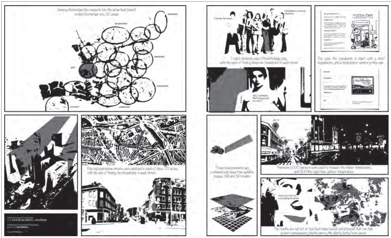
Slika 1: Vizualna predstavitev (zgodboris) raziskave (avtor: Frank van der Hoeven)

V raziskavi Hotterdam sta avtorja pridobila satelitske posnetke Landsat 5 in Landsat 8 iz spletne aplikacije EarthExplorer ameriške znanstvene agencije USGS ter vanje v postopku predobdelave vnesla geometrične in atmosferske popravke. Podobno kot satelitski posnetki Evropske vesoljske agencije so tudi posnetki Landsat prosto dostopni na spletu.