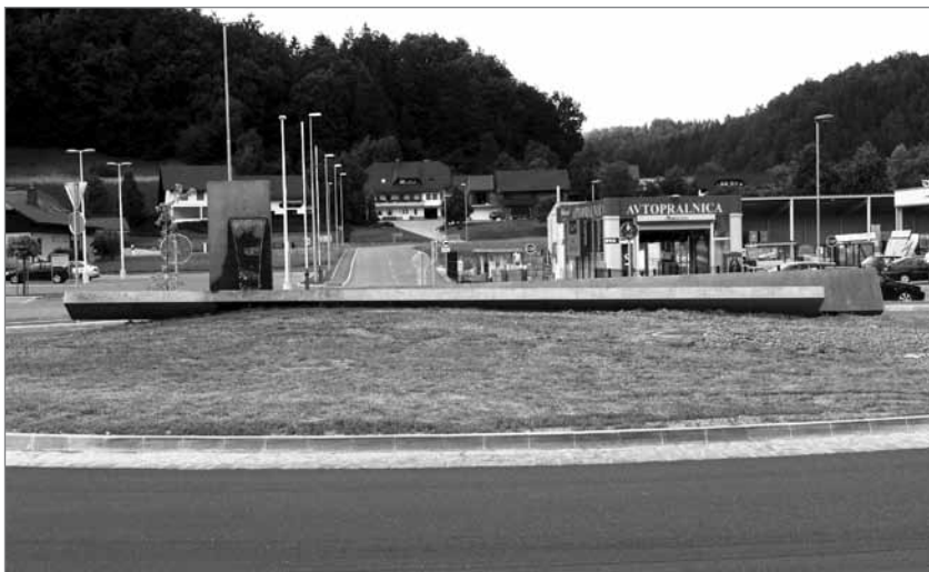
Slika 3: Motiv vode in kamna