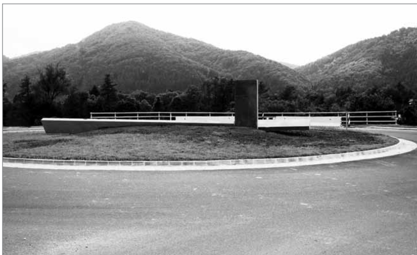
Slika 2: Figura splavarja