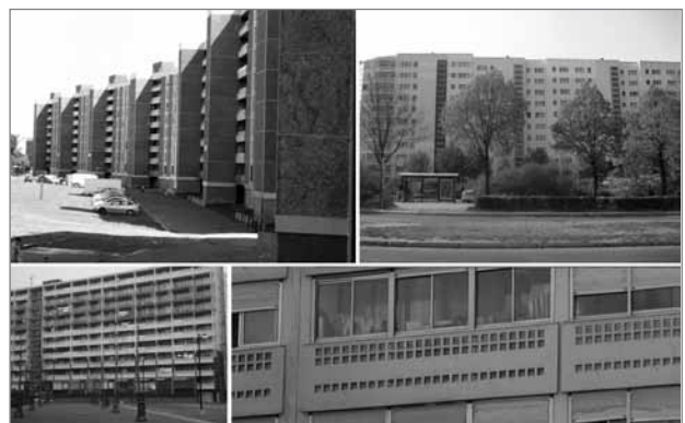
Slika 2: Prenavljanje nebotičniških naselij