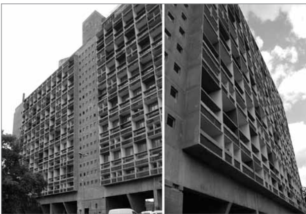
Slika 1: Le Corbusierjeva Unité d'habitation, Firmini (foto: Caroline Newton)

Marseille, maj 2006. Ko smo se približevali Cité Radieuse , Le Corbusierjevi modernistični mojstrovini, orjaškemu sivemu stanovanjskemu bloku na stebrih (slika 1), sva nekega študenta vprašala, kaj mu je ob pogledu na mogočno zgradbo najprej prišlo na misel. Mladenič, ki je bil doma iz enega od najbolj podeželskih območij v Flandriji v Belgiji, je odgovoril: »Spominja me na kletke za baterijsko rejo.« Dan pozneje so se študentje, ki so hodili pred nama, nenadoma ustavili in niso hoteli naprej do enega izmed naselij s socialnimi stanovanji v severnem predmestju Marseilla. Ožgana pročelja in staljeni asfalt so pričali o nasilnih spopadih. Še bolj jih je prestrašila izjava hotelske receptorke. Zatrjevala je, da so severna predmestja veliko prenevarna, da bi jih obiskali, in nas prepričevala, naj ne gremo tja.