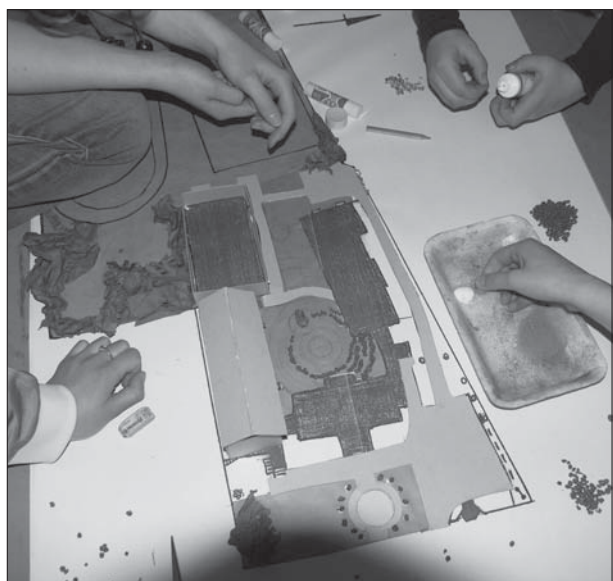
Slika 3: Skupinsko delo – projektiranje šolskega vrta (foto: Beata J. Gawryszewska).

Udeleženci na delavnicah iščejo elemente, ki izražajo vrednote okoliške mestne pokrajine. Zberejo dokumentacijo – skice, fotografije, herbarije itd. Nato se pogovorijo o potrebah šolske skupnosti, ki se navezujejo na šolski vrt, dajo vrtu obliko in opišejo materiale oziroma elemente, ki jih mora vrt vsebovati. Na podlagi dokumentacije in zbranih materialov oblikujejo model. Učenci nato k sodelovanju povabijo študente urejanja krajine, ki zanje izdelajo konceptualne skice. Nato vsak izmed udeležencev izbere enega izmed elementov projekta in ga uresniči.