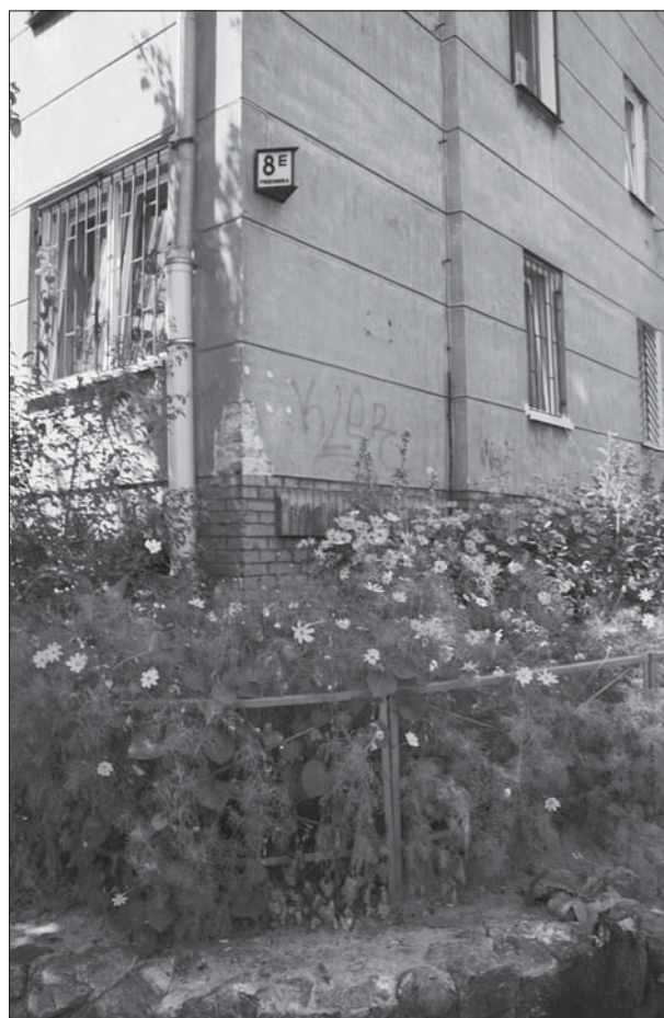
Slika 1: Nadomestek za vrt pred hišo v naselju družbenih stanovanj WSM Żoliborz.

Kulturna krajina spominja na naravno krajino s prostorom v naselju, ki posnema naravno krajino – z nepozidanim oziroma redko pozidanim območjem. V mestni krajini je kulturna krajina ustvarjena umetno, v predmestjih in na podeželju pa je naravno nadaljevanje odprtih območij, ki so jih njihovi uporabniki (prebivalci) delno spremenili. Zdi se, da je kulturna krajina v naselju nujna. Če je okolje zelo spremenjeno že ob nastanku vrtov in (to je s tem povezano) zelenih prostorskih struktur, potem uporabniki ustvarijo krajino, ki spominja na naravno tako, da naravnim procesom prepustijo del posesti, ki je najbolj oddaljen od hiše.