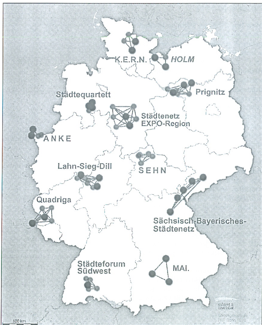
Slika 1: Pilotni projekt urbanih omrežij v Nemčiji

Deželni prostorski razvojni plan prikazuje sodelujoči centralni kraj višje ravni, ki obsega tri mesta: Bautzen, Goerlitz in Hoyerswerda v vzhodni Saški. Treba je opozoriti, da je vzhodna Saška območje dežele z najhujšimi problemi gospodarske in družbene tranzicije. Z vidika deželne vlade je v tem območju sodelovanje zainteresiranih posameznikov v regionalnem razvoju nujno, možnost pa sploh ni bila videna pred deželno pobudo.